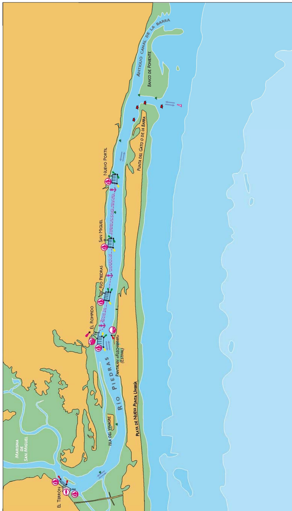
Esquema de la desembocadura del río Piedras

Gráfico «Esquema de la desembocadura del río Piedras».— Sustituir por gráfico siguiente: